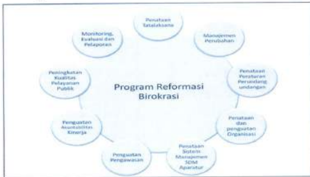
Gambar 3.4.2 Agenda Reformasi Birokrasi Kementerian Perdagangan

Untuk dapat menjalankan tugas pokok dan fungsi Kementerian Perdagangan secara optimal maka dibutuhkan SDM yang memiliki kapasitas dalam membuat perencanaan, melaksanakan program serta melakukan evaluasi serta monitoring pelaksanaan program-program yang telah direncanakan. Untuk meningkatkan kapasitas SDM yang saat ini dimiliki oleh Kementerian Perdagangan, fokus utama peningkatan kapasitas SDM tersebut dihadapkan pada pengembangan perencanaan pengembangan SDM dengan berbasis pada kinerja. Rencana pengembangan SDM Kementerian Perdagangan dilakukan melalui: